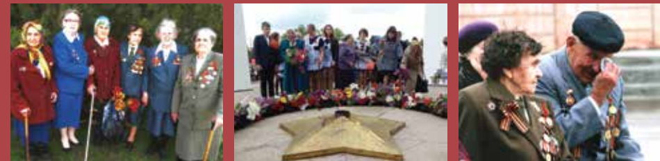
КНИГА ПАМЯТИ ОРЛОВСКИЙ РАЙОН